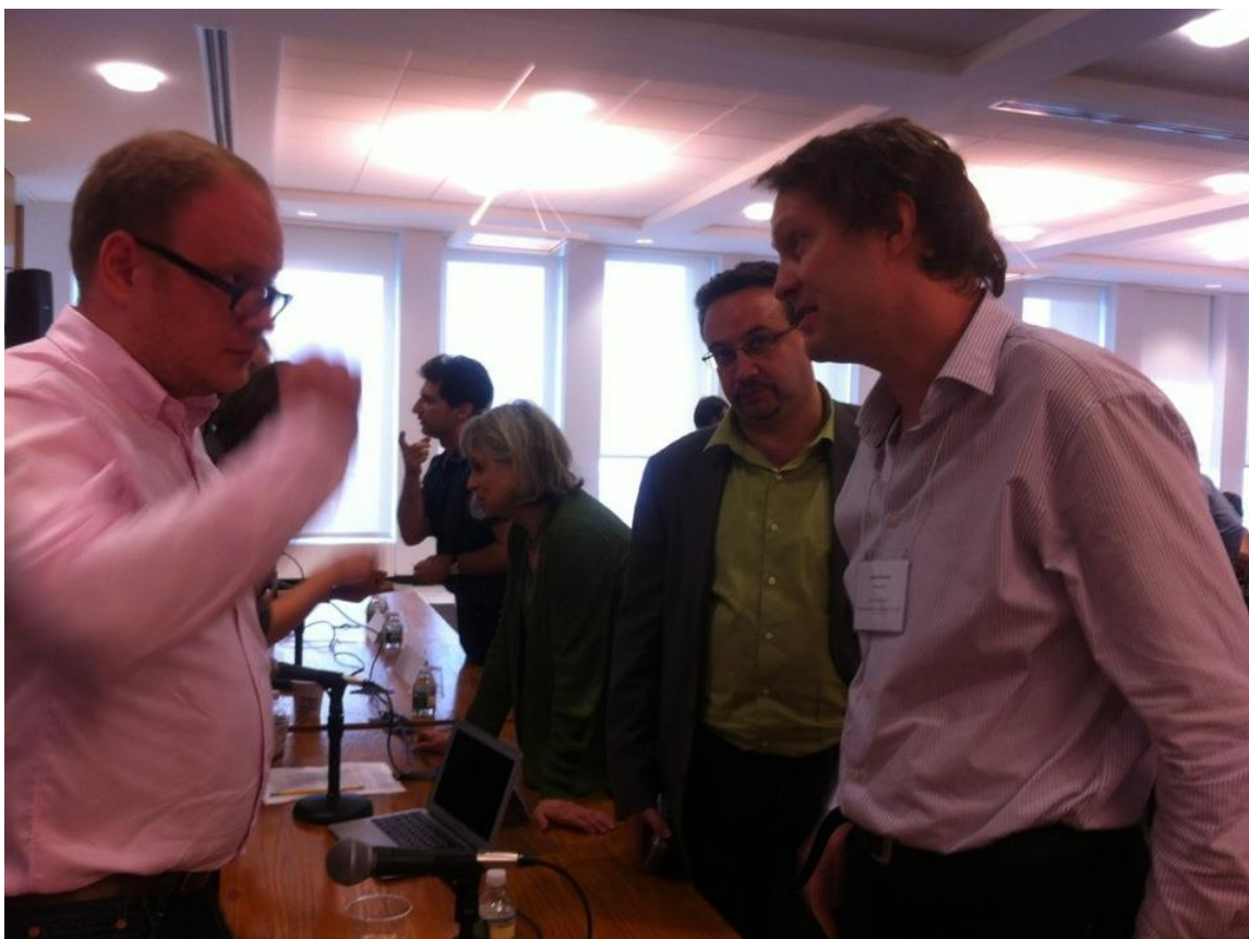
Люк Хардинг — справа

От Кашина: Несколько дней назад мы опубликовали интервью со знаменитым высланным из России британским журналистом Люком Хардингом, которое взяла друг нашего сайта Ирина Сисейкина. Теперь с разрешения самого Хардинга мы публикуем переведенные Ириной фрагменты из книги Хардинга Mafia State — автор перевода настояла на том, что «Государство-мафия» звучит точнее, чем буквальное «Мафиозное государство», и мы с ней согласны. До сих пор книга на русский язык не переводилась.