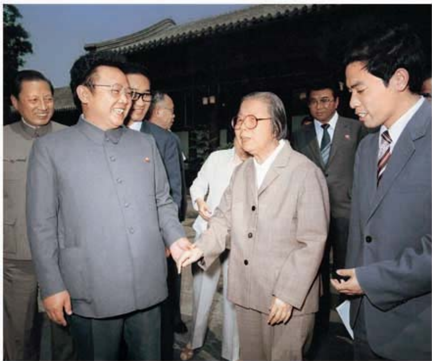
Ким Чен Ир тепло встречается с председателем Всекитайского комитета Народного политического консультативного совета Дэн Инчао (июнь 1983 г.).