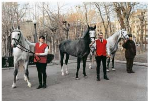
Председатель ГКО КНДР Ким Чен Ир осматривает рысаков орловской породы, посланных ему в подарок Президентом РФ В. В. Путиным (февраль 2003 г.).