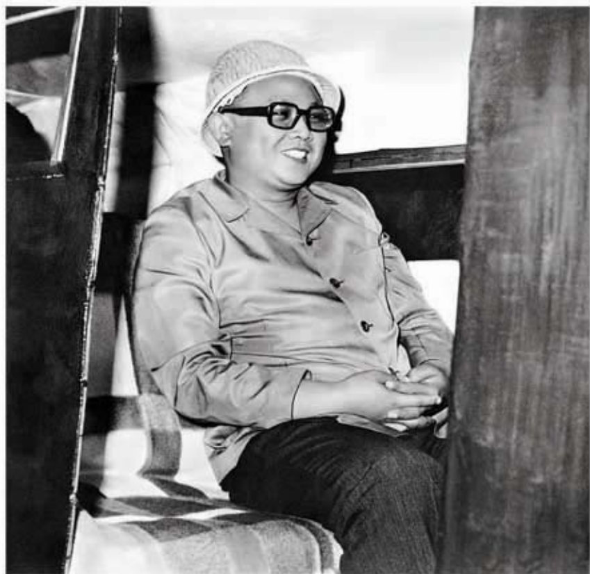
Комдокский рудник. Ким Чен Ир в рудничной пассажирской клети направляется в забой (июль 1975 г.).