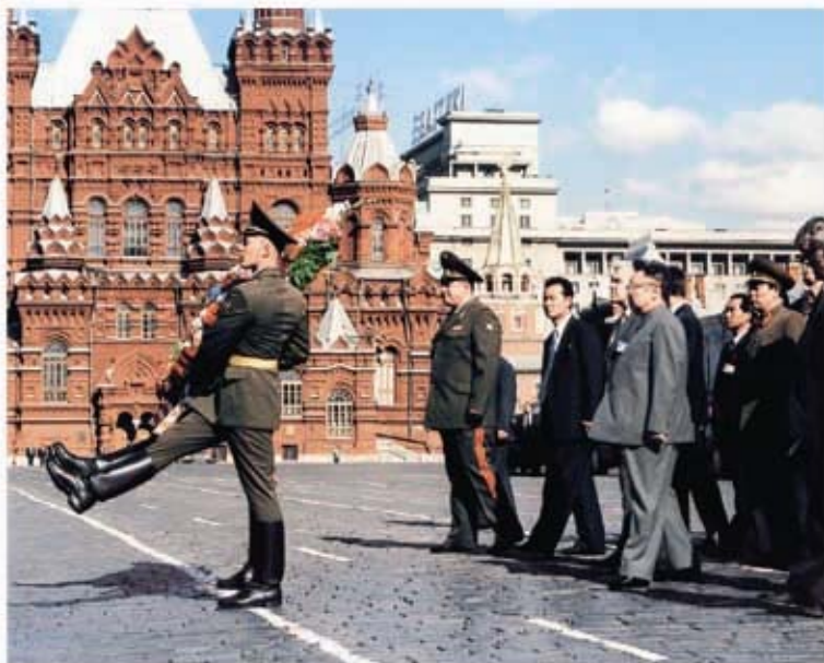
Возложение венка Ким Чен Иром к Мавзолею В. И. Ленина (август 2001 г.).