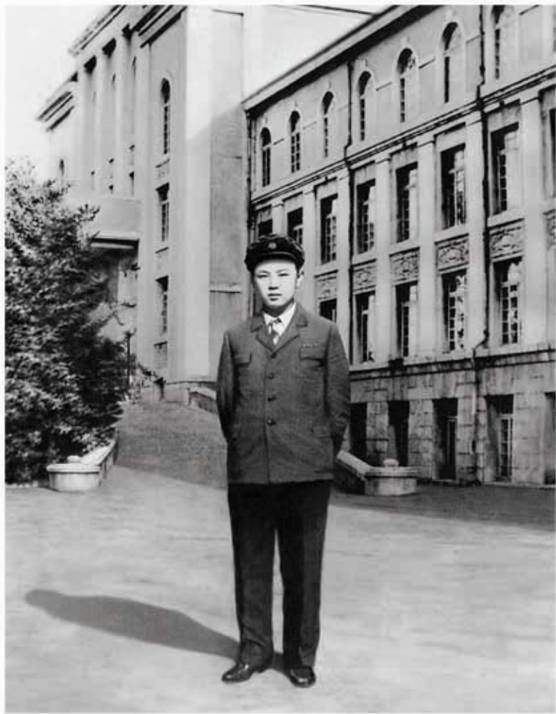
Ким Чен Ир в студенчестве в Университете имени Ким Ир Сена.