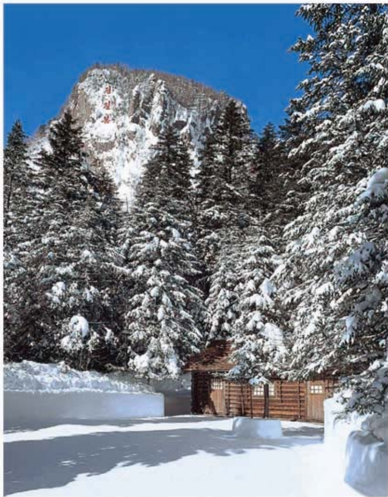
Родной дом Ким Чен Ира в Пэктусанском тайном лагере.