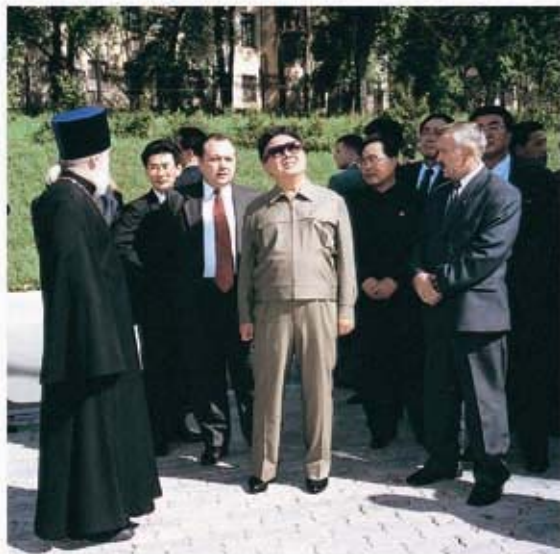
Ким Чен Ир осматри- вает православную цер- ковь в г. Хабаровске.