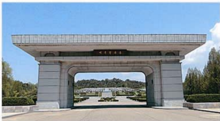
Ворота на Мемориальное кладбище патриотов.