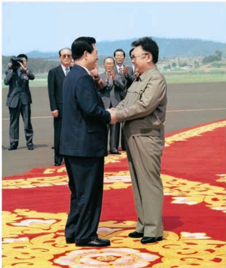
Председатель ГКО КНДР Ким Чен Ир встречается с Президентом Ким Дэ Чжуном, приехавшим в Пхеньян для межкорейского саммита (июнь 2000 г.).