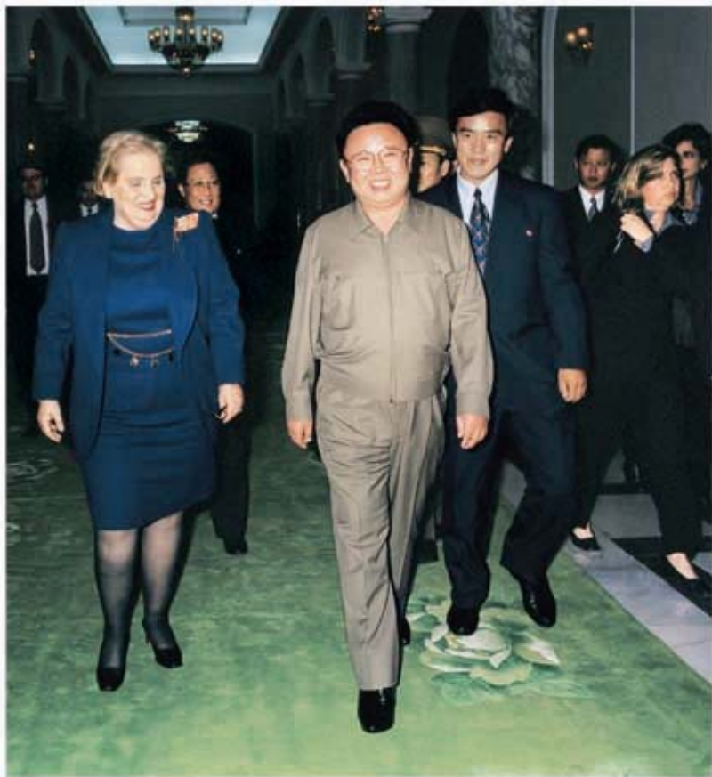
Председатель ГКО КНДР Ким Чен Ир принимает госсекретаря США М. Олбрайт (октябрь 2000 г.).