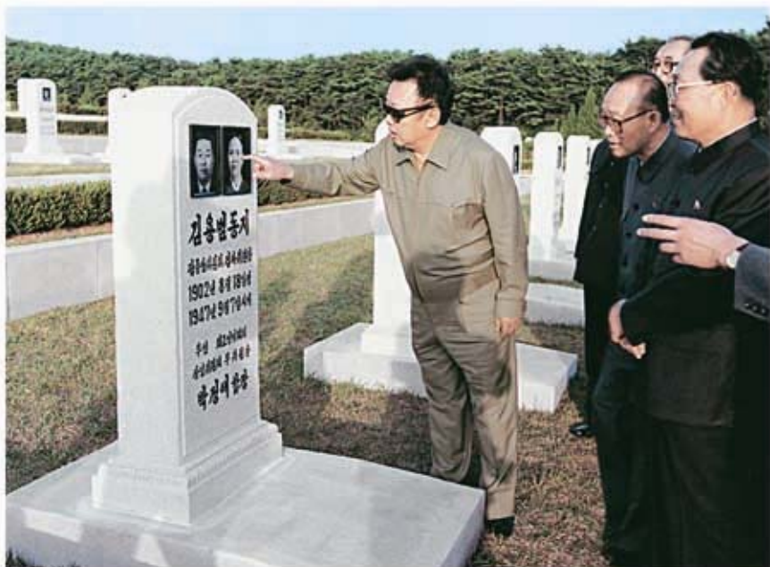
Ким Чен Ир осматривает Мемориальное кладбище патриотов (сентябрь 1998 г.).