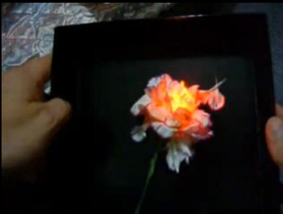
«Свелящийся цветок» rutube.ru

Свечение происходит независимо от того что в бутылке - напиток "маунтин дью" или вода из-под крана. Не трудно понять, что подобные видеоролики снимаются исключительно в целях рекламы.