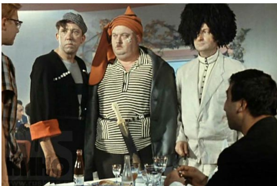
Кадр из фильма «Кавказская пленница»

Мораль проста и стара как мир - не всему, что показывают можно верить.