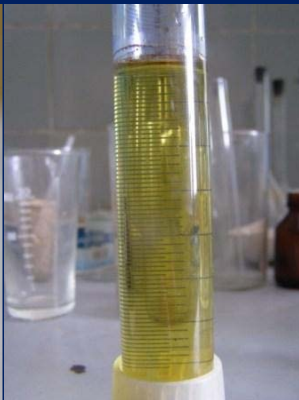
Раствор нитрата палладия