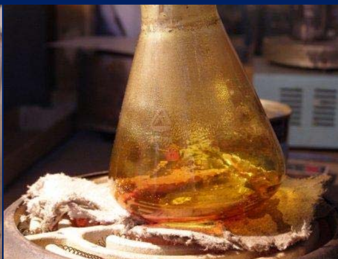
Колба, заполненная парами серы