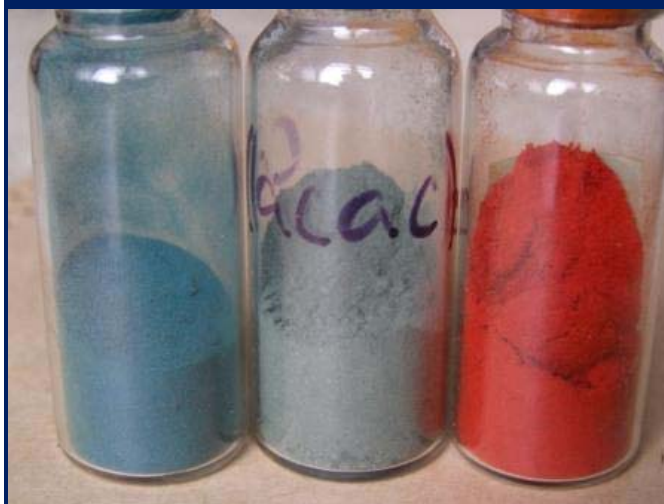
Ацетилацетонаты кобальта и железа (красный). Используются для получения кластеров металлов