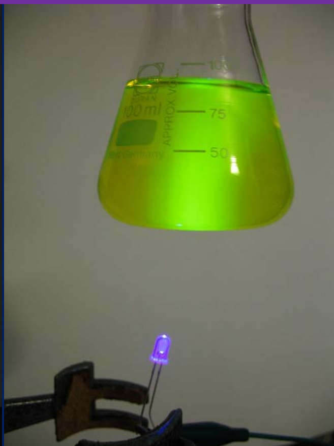
Наблюдение флюоресценции