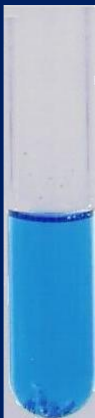
Хлорид хрома (II). Получен восстановлением \text{CrCl}_3 водородом в момент выделения. На дне пробирки видно гранулы цинка. (youtube.com)