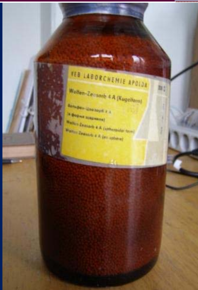
Цеолиты с размером каналов 4А. Выпущены еще до объединения Германии.