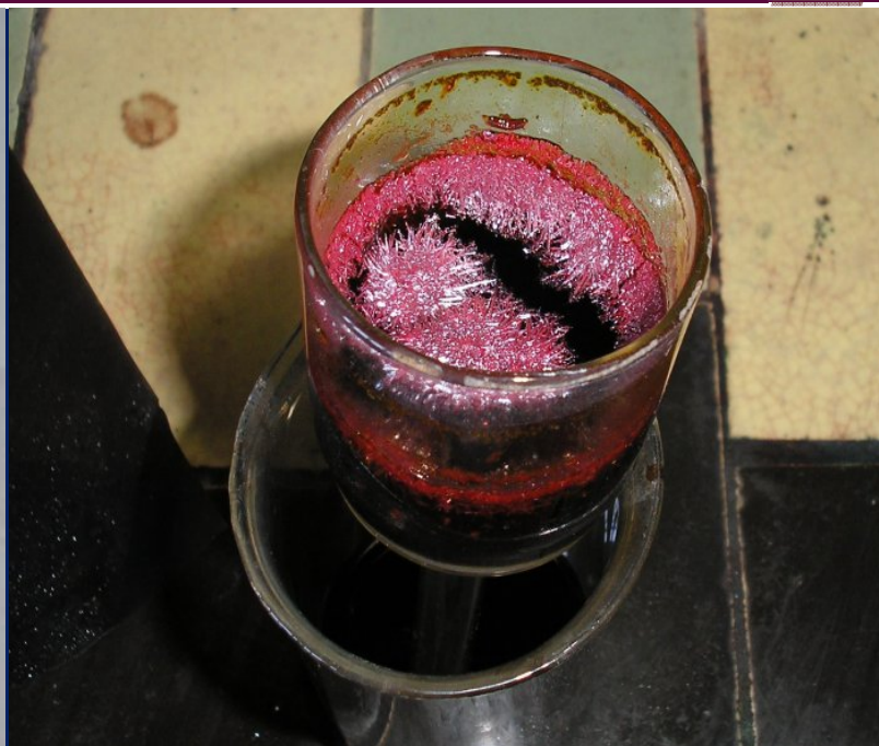
Вот такие кристаллы выросли в хромовой смеси